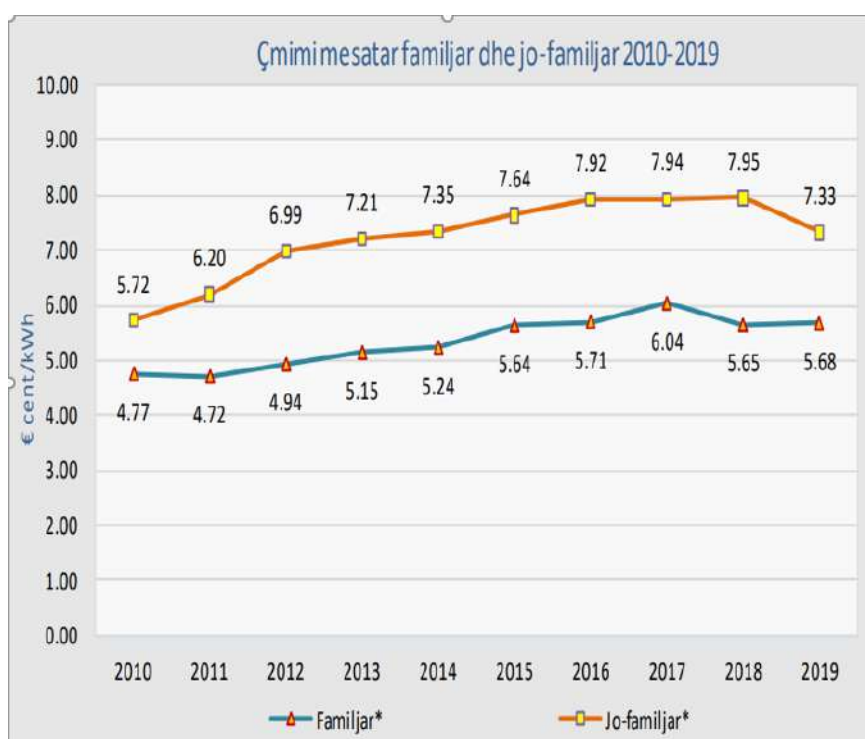
Tabela 3. Çmimi mesatar familjar dhe jo-familjar 2010-2019

629,359 përfitues të këtij subvencionimi